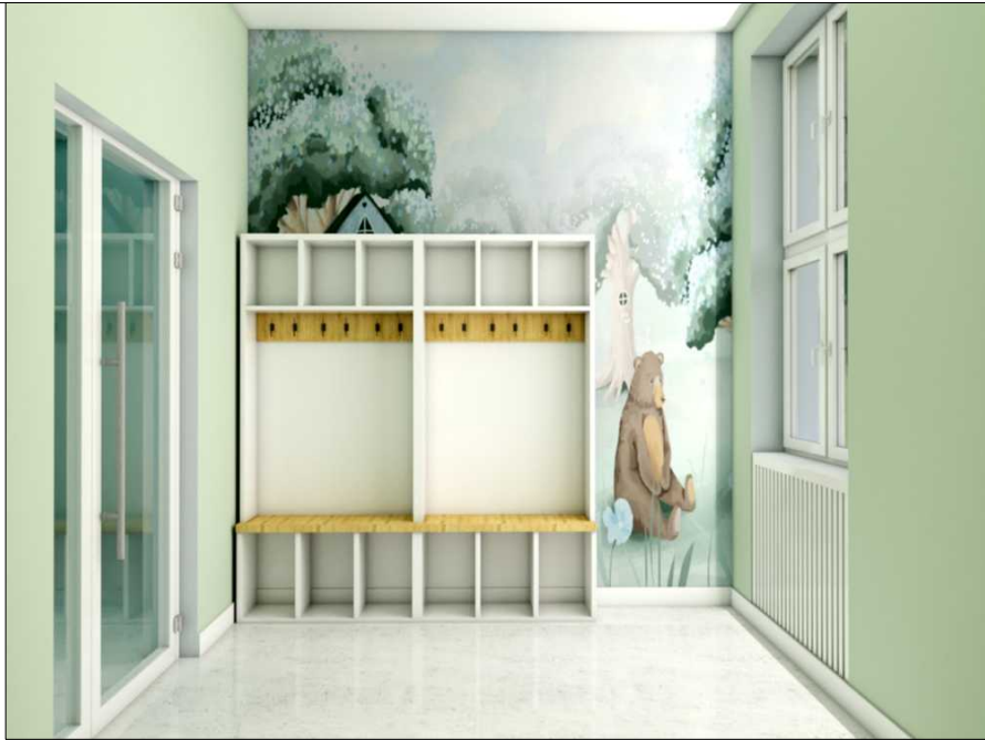
POM. 1.18. SZATNIA ODDZIAŁU I