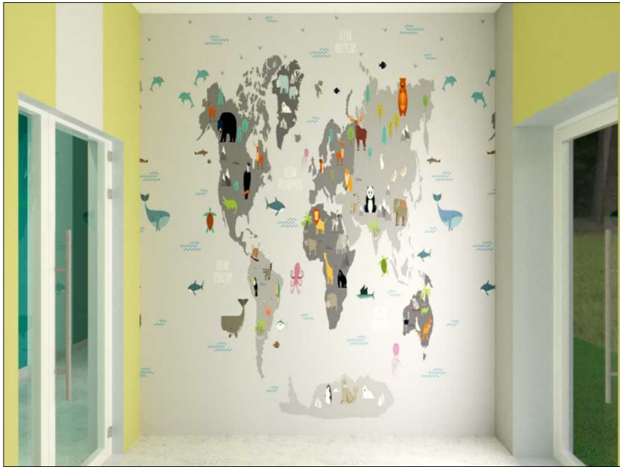
POM. 1.1. KOMUNIKACJA